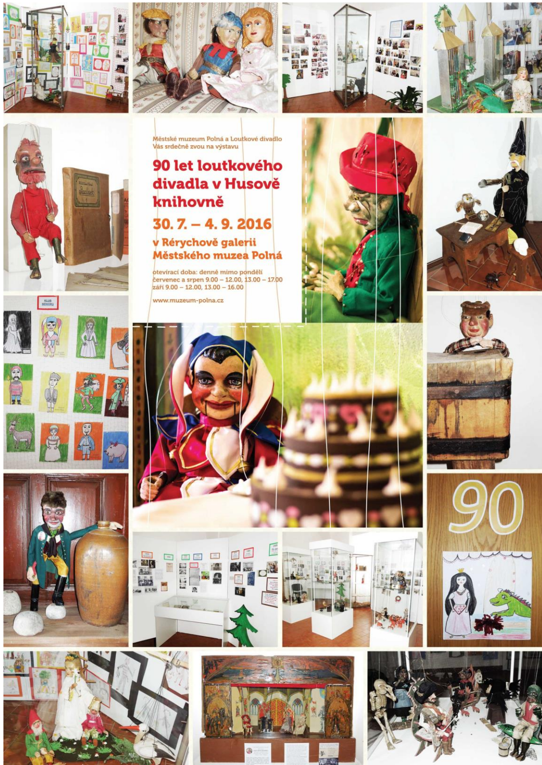
Výstava „90 let loutkového divadla v Husově knihovně.“