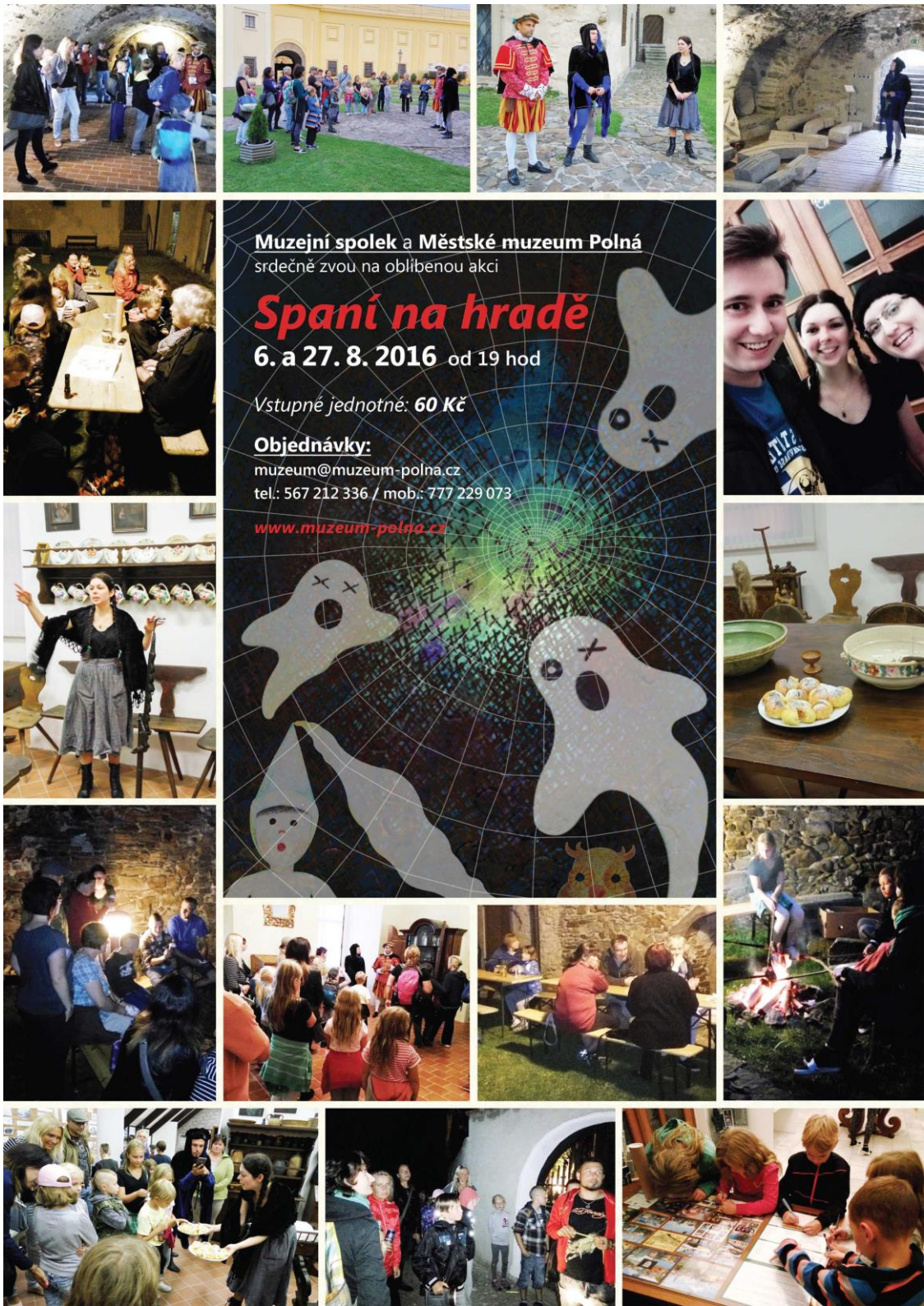
Spaní na hradě