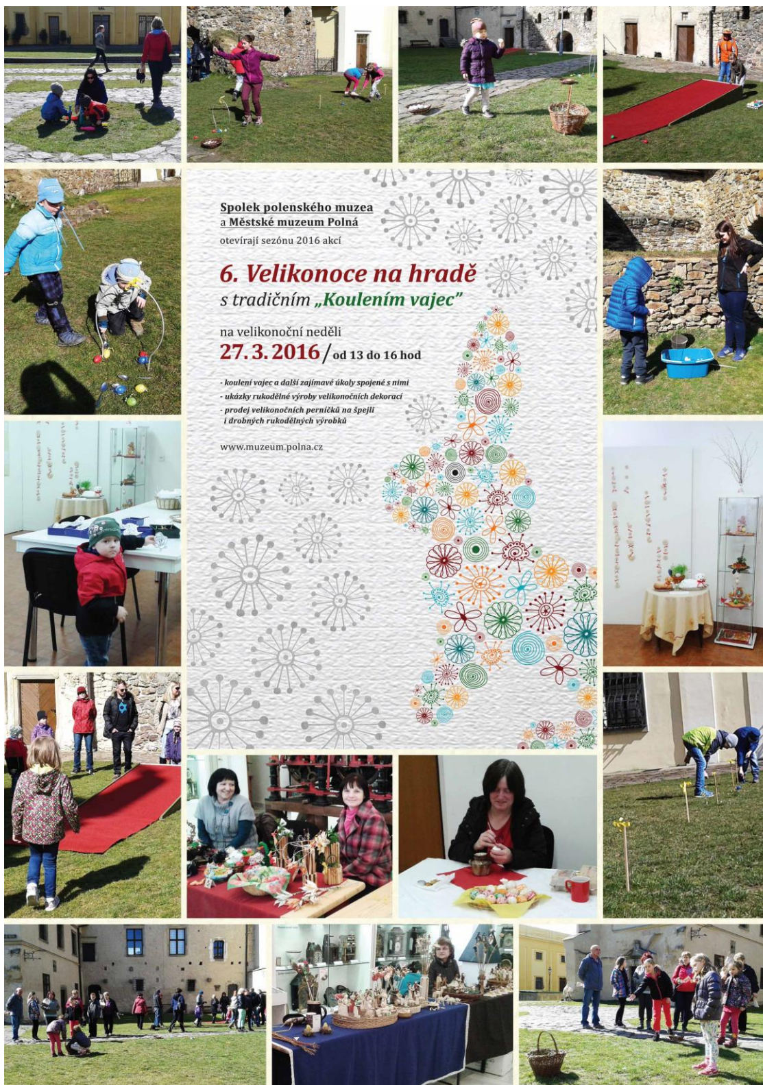
6. Velikonoce na hradě s tradičním „Koulením vajec“