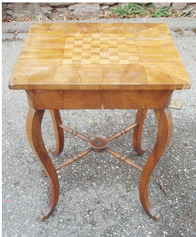
Stolek obdélný, jednozásuvkový, intarzovaný, šachový (stav před restaurováním)