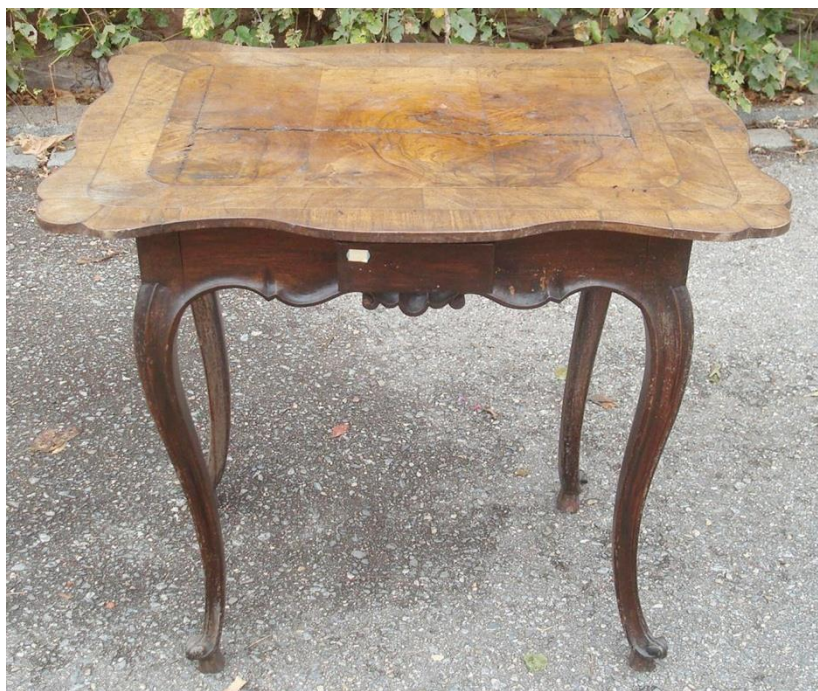
Stolek hrací čtyřzásuvkový, intarzovaný, řezbovaný (stav před restaurováním)