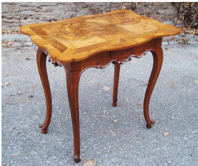
Stolek hrací čtyřzásuvkový, intarzovaný, řezbovaný (stav po restaurování)