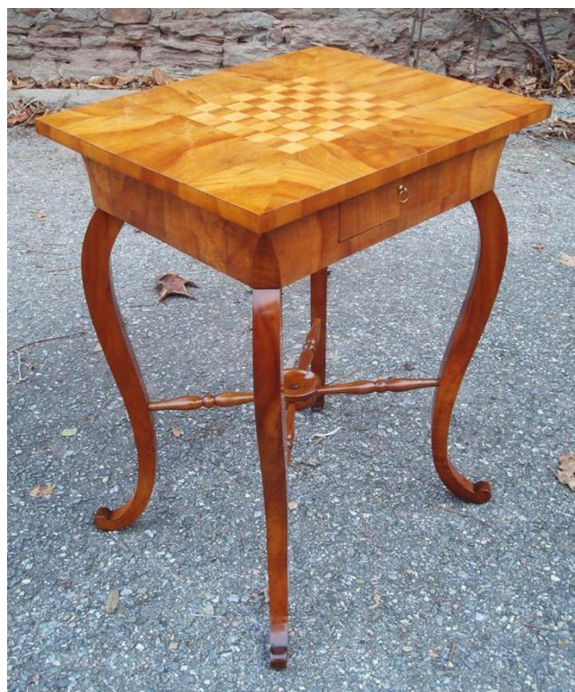
Stolek obdélný, jednozásuvkový, intarzovaný, šachový (stav po restaurování)