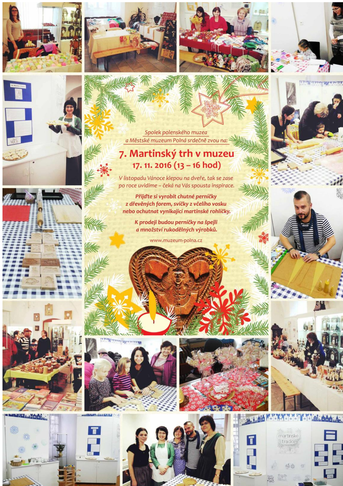
7. Martinský trh v muzeu