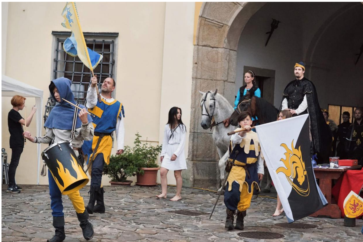
Hradní slavnosti v režii Novus Origo.