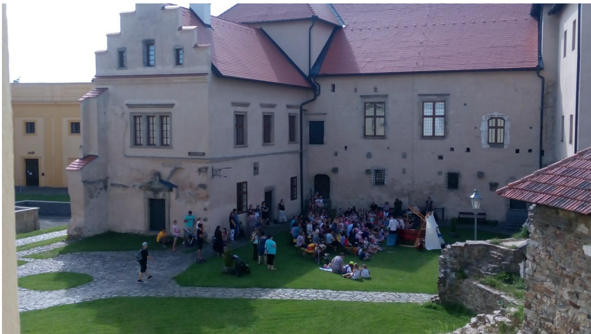
Pohádková nedělní odpoledne přilákala na nádvoří rodiny s dětmi. Organizuje město Polná.