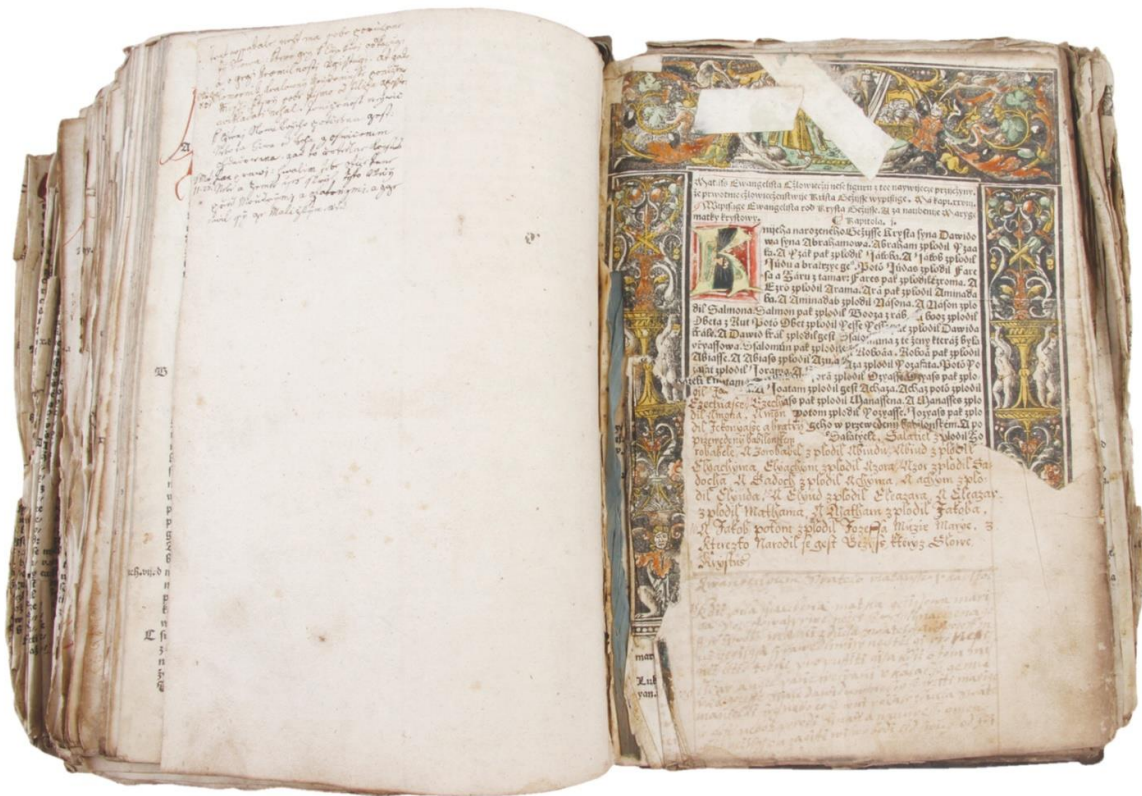
Benátská bible (stav před restaurováním)