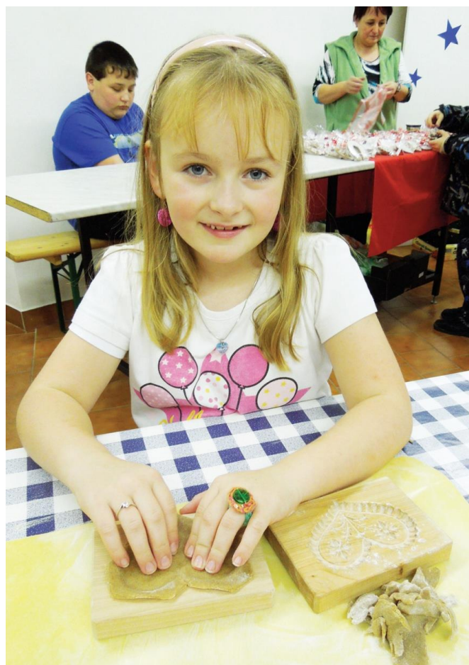
Martinský trh v muzeu