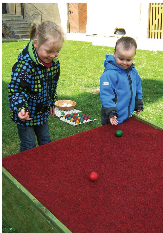
Koulení vajec na hradě