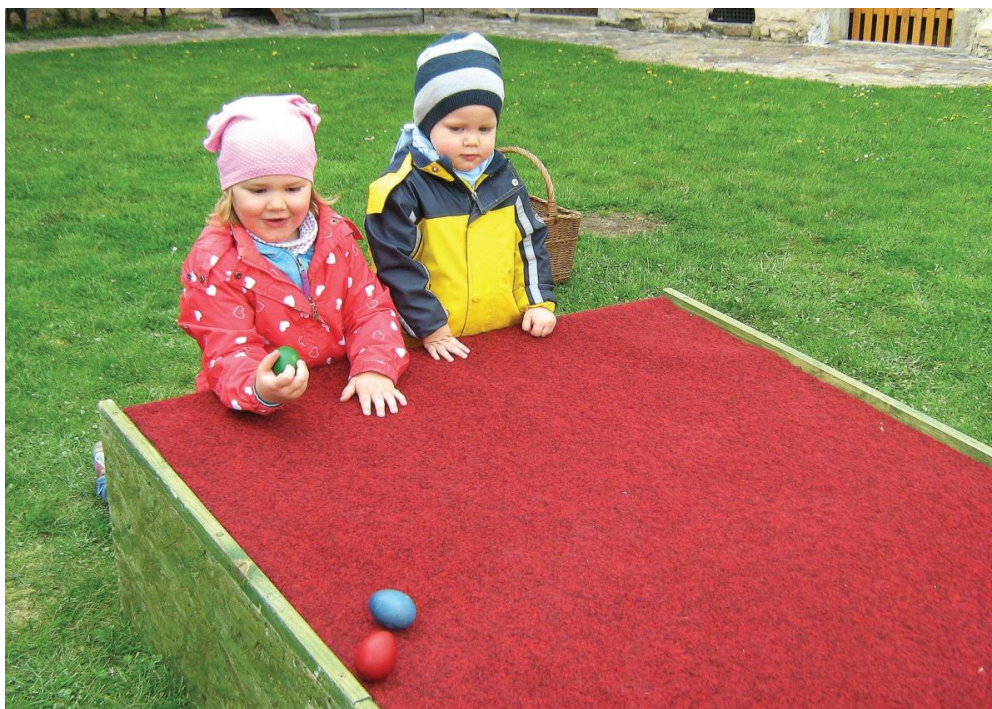
Koulení vajec na hradě