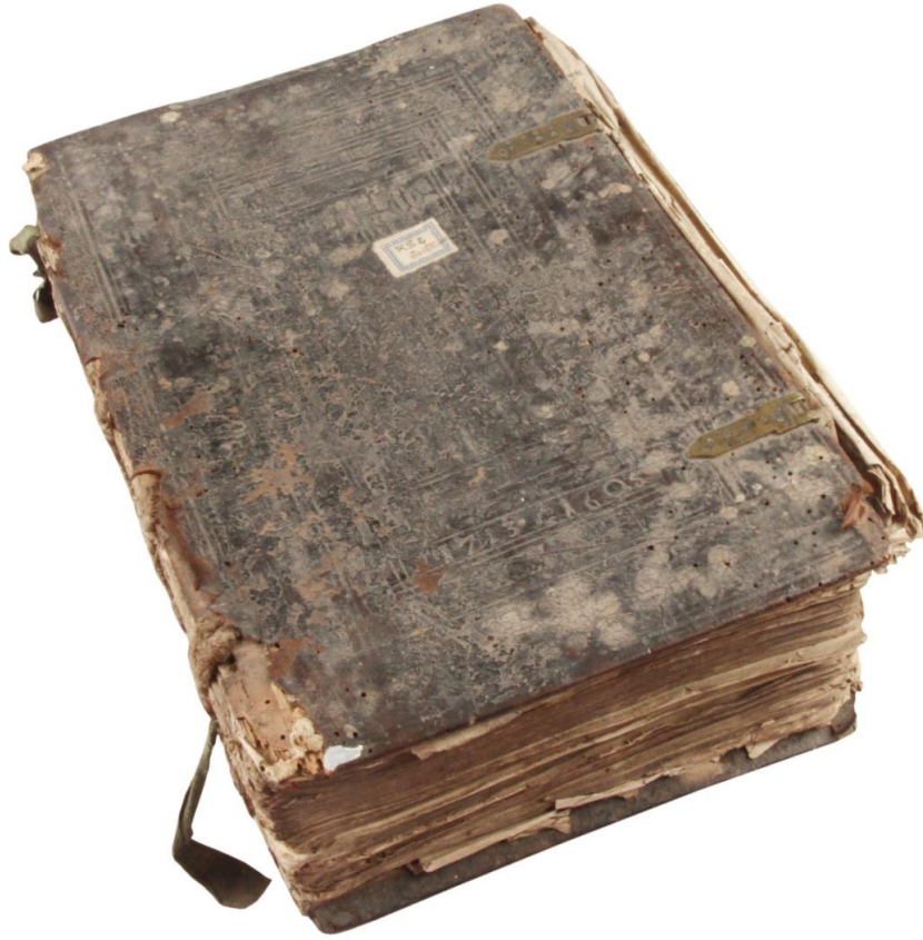
Benátská bible (stav před restaurováním)