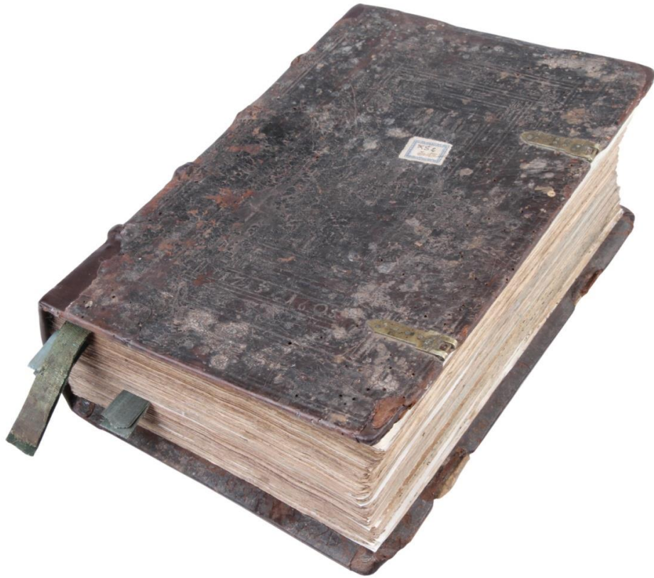
Benátská bible (stav po restaurování)