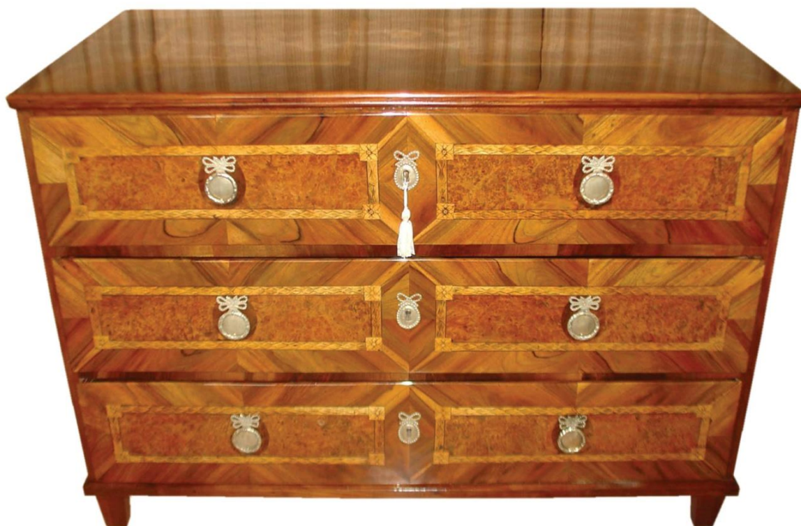
Komoda barokní (stav po restaurování)