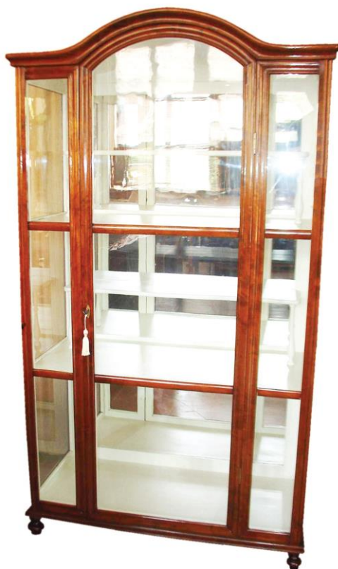
Skleník (stav po restaurování)