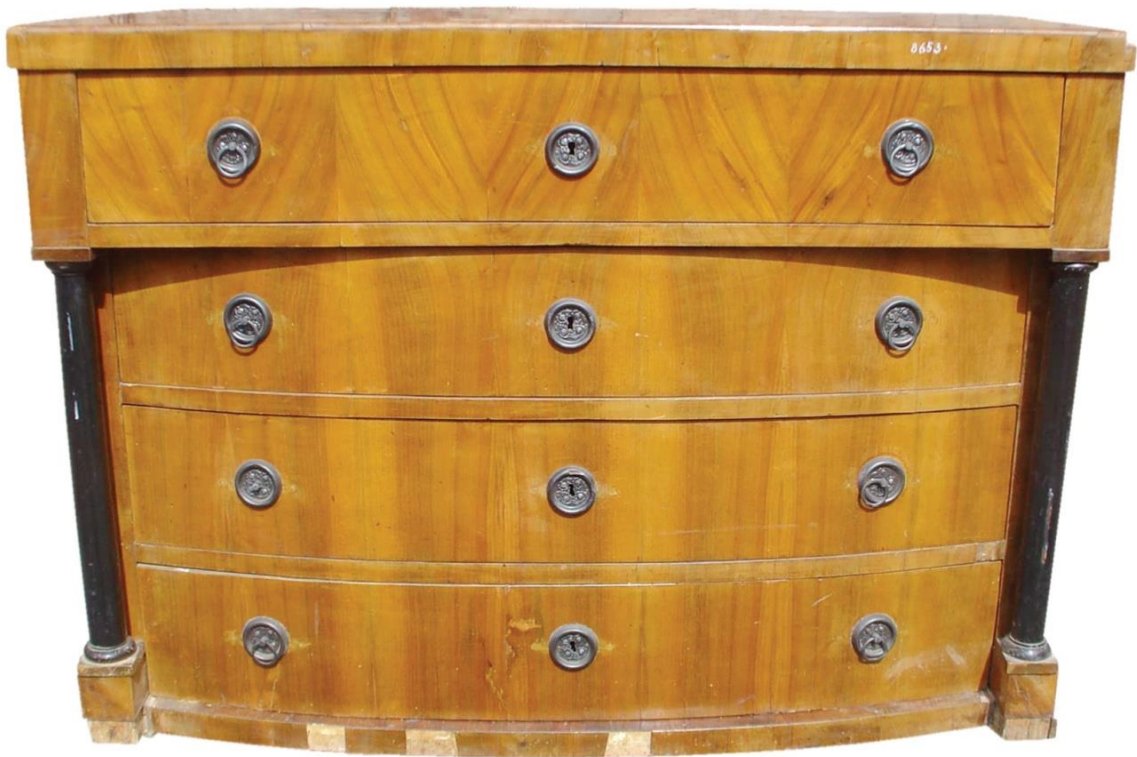
Komoda empírová (stav před restaurováním)