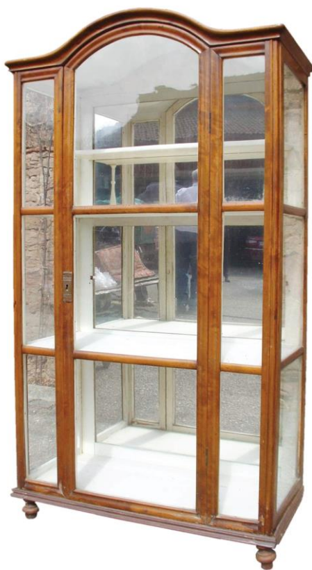
Skleník (stav před restaurováním)