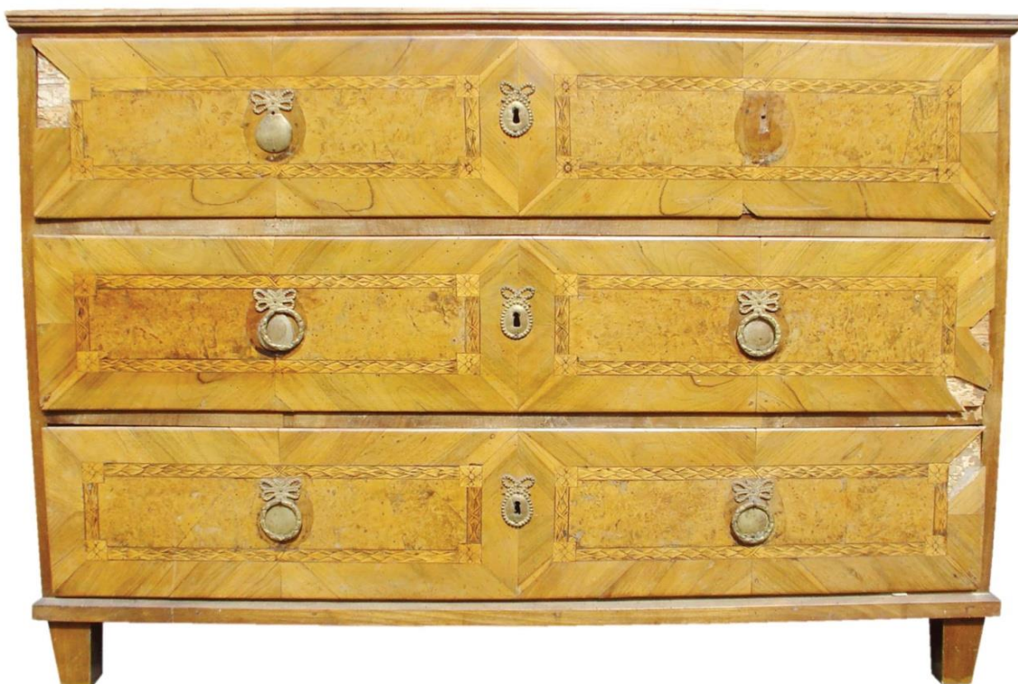
Komoda barokní (stav před restaurováním)