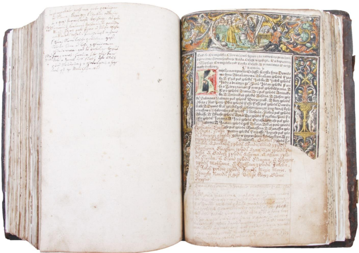
Benátská bible (stav po restaurování)