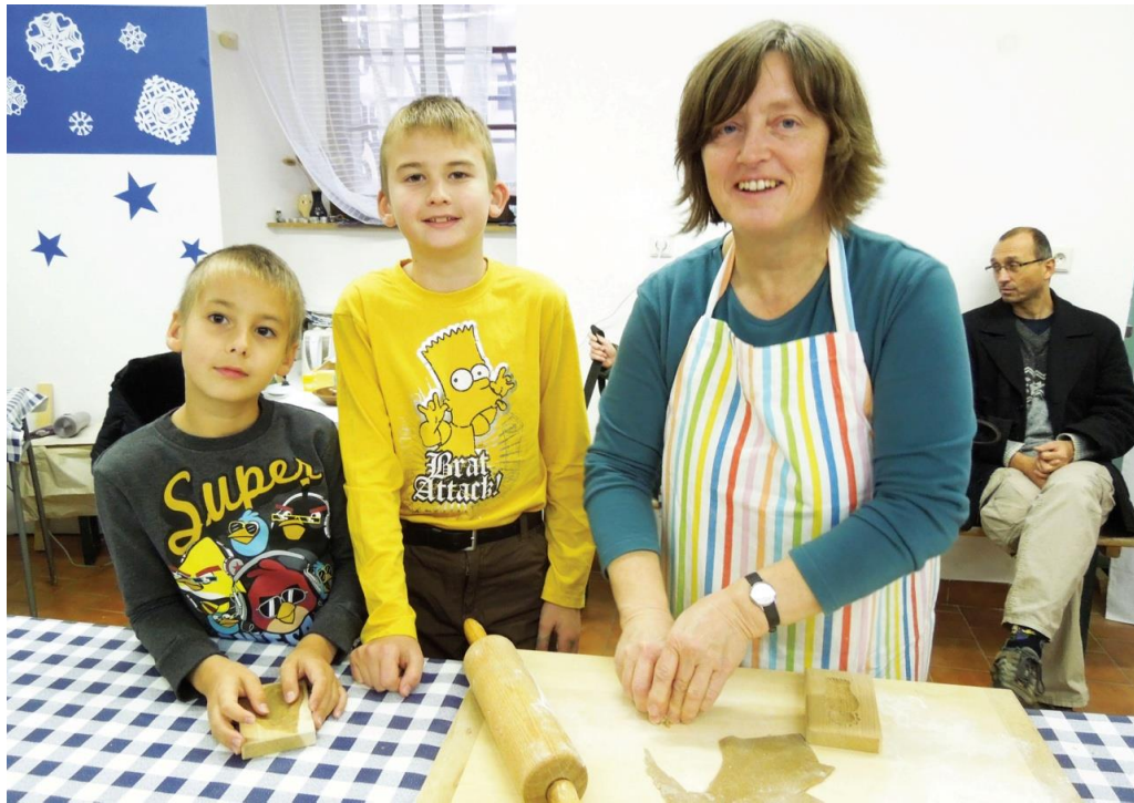
Martinský trh v muzeu