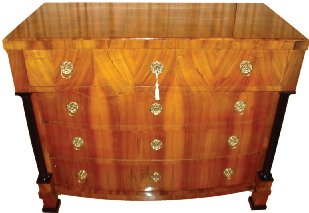
Komoda empírová (stav po restaurování)