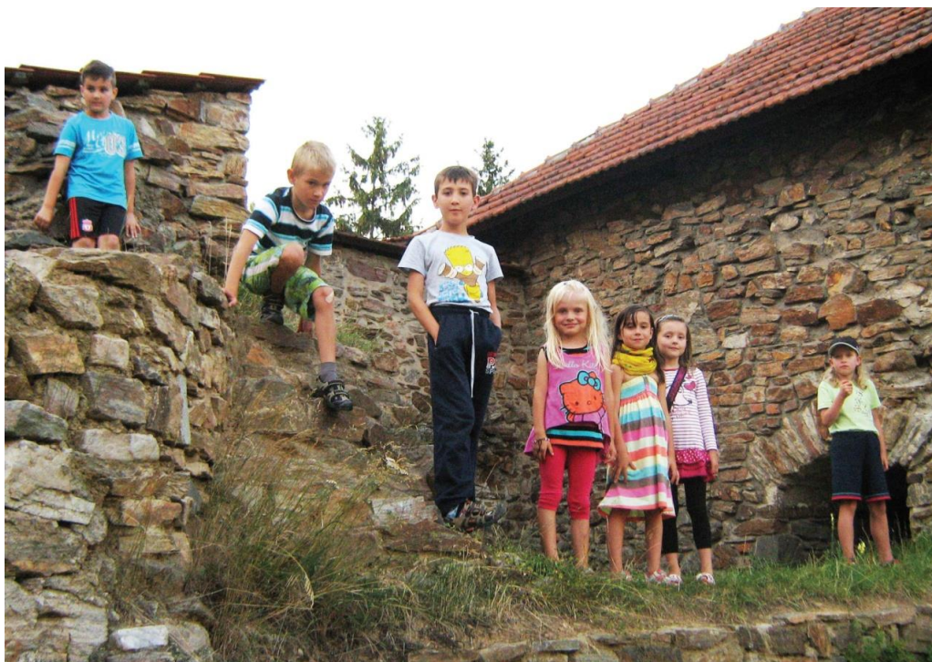
Spaní na hradě